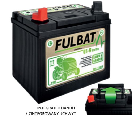
INTEGRATED HANDLE / ZINTEGROWANY UCHWYT