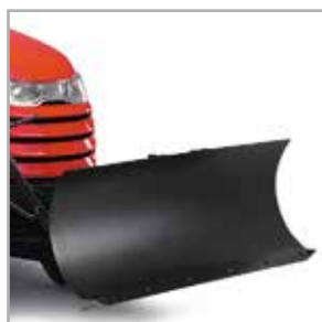
Lemiesz do sychania