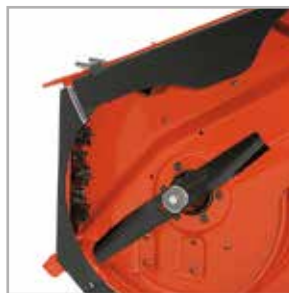
Zestaw do mielenia