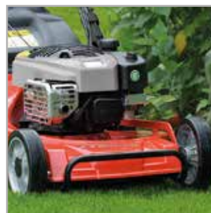
TRWAŁY I WYTRZYMAŁY Przedni zderzak i boczne listwy stanowią dobre zabezpieczenie dla obudowy kosiarki odlanej z aluminium.