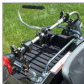
Zestaw uchwyty Rhino