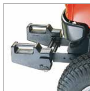
Obciążnik ramy przód/tył