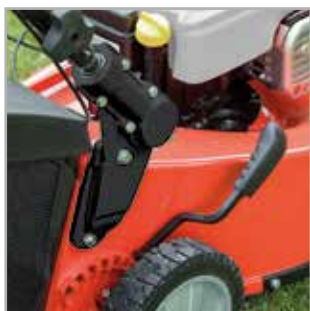
SYSTEM ANTYWIBRACYJNY Uchwyt kosiarki z systemem antywibracyjnym w obu modelach.

Kosiarki Simplicity® z aluminiową obudową z własnym napędem ułatwiającym koszenie ze zmienną prędkością jazdy, wyposażone są w anty-wibracyjny system dla lepszego komfortu pracy oraz przedni zderzak, zapobiegający uszkodzeniom obudowy podczas koszenia.