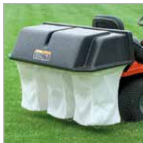
Potrójny kosz na trawę