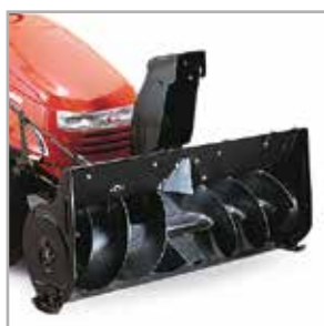
Jednostopniowy wirnik do odsnieżania