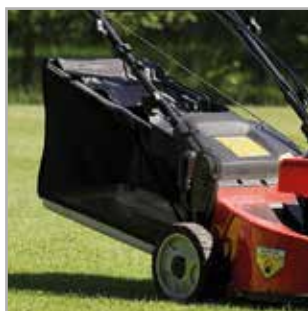
KOSZ NA TRAWĘ Pojemny kosz na trawę 65 litrów w Duke™ 48AL lub 70 litrów w Duke™ 53AL.