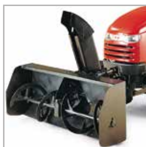
Dwustopniowy wirnik do odsnieżania