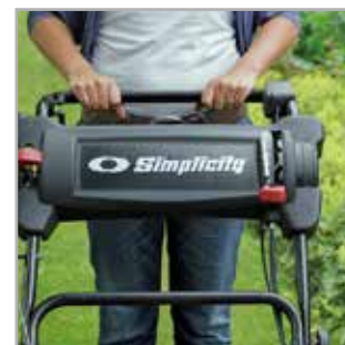
ZMIENNA PRĘDKOŚĆ JAZDY Dźwignia zmiennej prędkości jazdy pozwala łatwo ustawić i regulować prędkość.