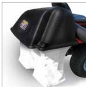
Podwójny kosz na trawę